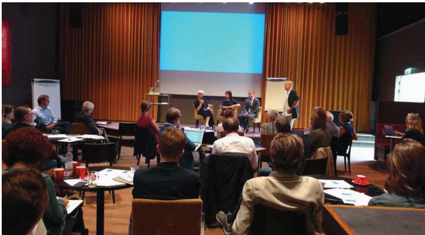
Werkbijeenkomst van de ketenpartners om tot het voorstel van wet te komen.

achtereenvolgens de Aanwijzing slachtofferzorg en de Aanwijzing slachtofferrechten (2018). Schadebemiddeling door de politie behoorde in de richtlijnen tot de standaardtaken van de politie. In de laatste aanwijzing uit 2018 is zij belegd bij het Openbaar Ministerie.